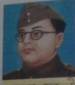
सुभाष चंद्र बोस