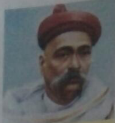
बाल गंगाधर तिलक