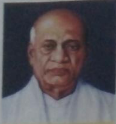
सरदार वल्लभ भाई पटेल

(क) भारत की आज़ादी के लिए लड़ने वाले इन महान व्यक्तियों को पहचानिए, व इनके नाम लिखिए-