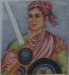
रानी लक्ष्मी बाई