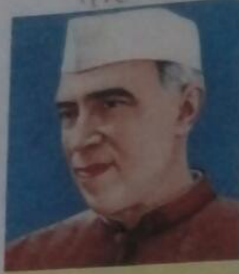
पं. जवाहर लाल नेहरू